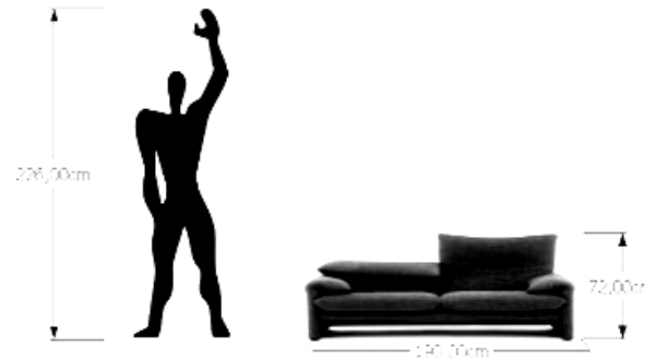
Misura uomo-oggetto secondo il modulo di Le Corbusier